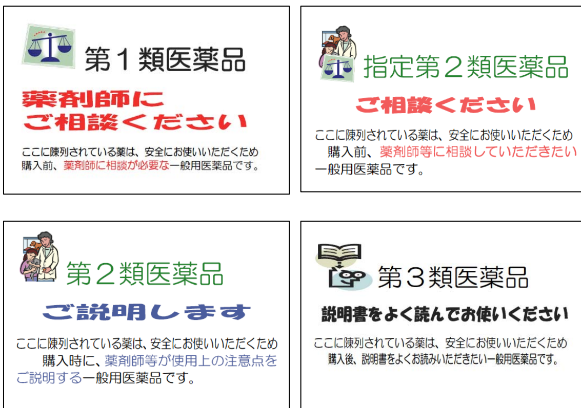
図 2-4-1. 薬局の陳列棚での掲示例（一例）