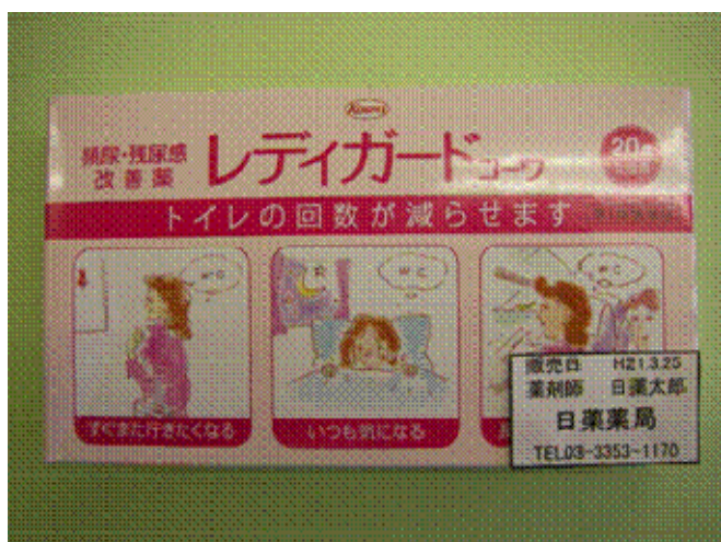
図2-1-2. 販売者責任シールの貼付例